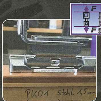
Certificazione resistenza meccanica secondo TBDK

Gamma completa di viti con doppia certificazione