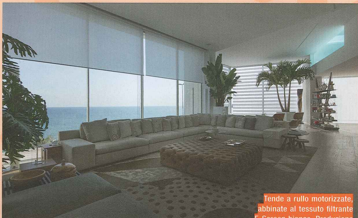
Tende a rullo motorizzate, abbinare al tessuto filtrante E-Screen bianco. Produzione Resstende