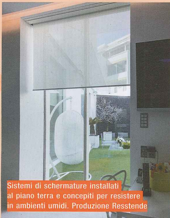
Sistemi di schermature installati al piano terra e concepiti per resistere in ambienti umidi. Produzione Resstende