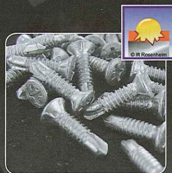
Certificazione di resistenza alla corrosione fino a 2.000h