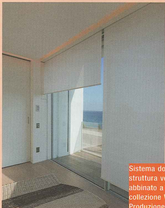
Sistema doppio, che include nella stessa struttura verticale un sistema ZIP contro vetro, abbinato a tessuto decorativo filtrante della collezione White Inspiration (linea Laylight). Produzione Resstende